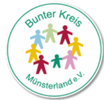
Bunter Kreis Münsterland e.V. Poststraße 5 48653 Coesfeld

Tel.: 05971 42-1749 bunterkreis-rheine@mathias-stiftung.de